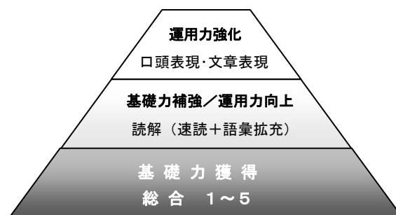
図1 授業科目のイメージ

同志社日文センター提供の日本語科目は、表1のように、毎日連続して行われる「総合」と技能別科目に分けられ、大きく2本立てとなっている。基幹科目である「総合」は、ロールプレイやディスカッション、長文・短文の聞き取り、200~400字程度の作文等も取り入れ、文字通り総合的な授業内容となっているが、どちらかというといはれ、インプット中心である。一方、技能別科目はアウトプットに主眼が置かれ、「総合」とは相補的に成り立っている。そのうち、「口頭表現」、「文章表現」は、科目の特性からしても、習得した知識を運用する活動が主となるが、「読解」、特に本稿で報告する「読解C」は、語彙の拡充を目的とした授業であり、ちょう