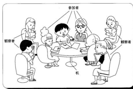
図2 フィッシュボウルイメージ図

「ディスカッション練習」では、自律型対話を実践できる対話能力の育成にあたり、実践と観察を重視し、フィッシュボウルと呼ばれる形態を採用している。フィッシュボウルとは、金魚鉢の金魚を眺めるように参加者の議論の様子を観察者が観察するものである（図2 大塚・森本 2011）。観察では、日本人大学生のディスカッションの分析をもとに策定された対話プロセスを評価する指標（鈴木他 2008）により、話し合いを多角的に観察することができ、観察の結果得られた気づきを、次の話し合いに還元する仕組みとなっている。