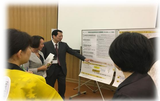
調査研究推進委員会活動報告会 (10/9)

特別プログラムの開催は、 愛媛新聞 (2016年10月9日付) でも取り上げていただきました。 大会プログラムおよび発表要旨はこちら をご覧ください。