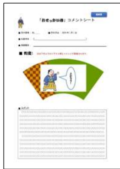
↑「コメントシート」のイメージ