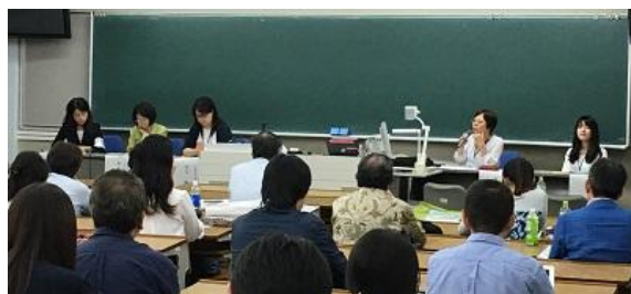
応募企画パネルディスカッション 「外国ルーツの高校生のリテラシーの現状と展望」