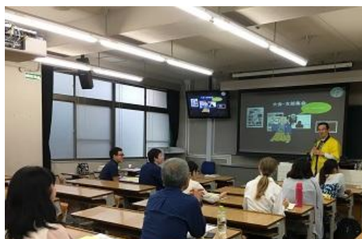
発表応募支援セミナー＆個別相談 （チャレンジ支援委員会）