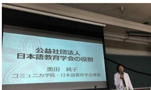
開会式 「公益社団法人日本語教育学会の役割」

本集会では、近年、喫緊の教育課題として注目を集めている外国ルーツの児童生徒の教育に焦点をあて、ブース展示とパネルディスカッションが行われました。ブース展示では関西地域で年少者教育を行っている団体や学術団体が日ごろの活動内容や現在抱えている課題について報告し、参加者と活発な意見交換を行いました。また、パネルディスカッション「外国ルーツの高校生のリテラシーの現状と展望」は、一般会員からの応募企画第1号として実現し、高校、地域、教員養成、言語使用の実態調査という多角的な視点から、これまであまり注目されてこなかった外国ルーツの「高校生」の問題を取り上げました。さらにチャレンジ委員会による発表応募支援セミナー＆個別相談では、学会発表のイロハの指南や応募書類に関する個別相談を行いました。