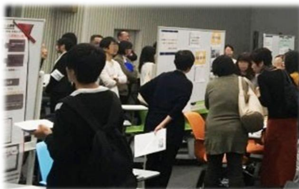
どのブースも活発な意見交換がなされた交流ひろば

山梨県内の出展者、参加者も多く、日本語教育や日本語指導に対する関心の高さが感じられました。今回の支部集会が今後の山梨県の日本語教育に少しでも役立ってくれば幸いです。そして、新しい試みもあった今回の支部集会は、今後学会が、それぞれの支部や地域にとってより有益な支部活動を考えるためのよい材料となりました。