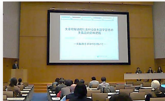
パネルセッション（25日）