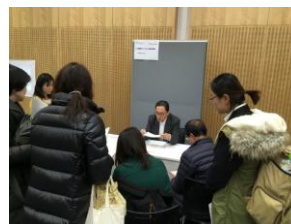
ハンドアウト利用のブース