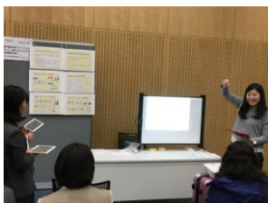
タブレット利用のブース

朱鷺メッセ 2 階の中会議室を会場として「交流ひろば」が開催されました。前半 90 分(13 時 45 分～15 時 15 分)には 7 つのブースが、後半 90 分(15 時 30 分～17 時)には 6 つのブースが 出展され、出展者と参加者が情報・意見交換、ネットワーク作りを目的として、それぞれのブ ースで活発なやりとりが行われていました。出展の形態も、ポスターを掲示したり、プロジェク ターやタブレットを利用したり、試作教材を手にとってもらったりしながらやりとりをしたりと、 バラエティーに富んだものとなりました。初めての企画ということで、来場者が少ないのではと 懸念しましたが、数多くの参加者にご来場いただき、出展者にとっても実り多い時間となっ たのではないかと思います。