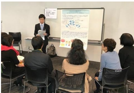
各ブースとも参加者は熱心に聞き入っていた

本年秋季大会から、大会開催地の日本語教育関係者が中心となって情報を発信する新企画「地域 発信企画」が 2 階小会議室 202 とホワイエで開催されました。新潟地域の日本語教育関連の実 践や活動、地域のシステム作りなどの情報について、現地の日本語教育に関わる方々が前半(12