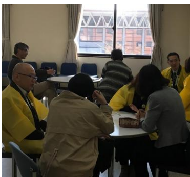
発表応募支援セミナー&個別相談 (チャレンジ支援委員会)