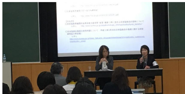
講演「日本語教育人材の養成・研修の在り方について」