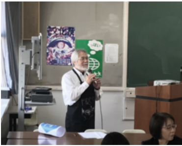
カフェマスターによる開店挨拶！

主 催 : 公益社団法人日本語教育学会 調査研究推進委員会 開催日時 : 2018 年 10 月 28 日 (日) 12 : 10-14 : 10 会 場 : 文化外国語専門学校 D53 講義室 参加者 : 37 名 (参加者 28 名、委員 9 名)