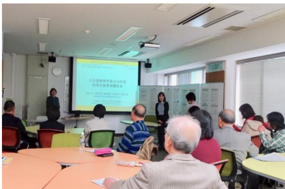
報告会全体のようす

報告会では、まず秋季大会全体の流れを簡単に説明した後、報告者が 1 人ずつ、自分が報告したい大会で得た情報や研究内容について簡単に紹介しました。その後、参加者は、自分の興味がある報告者毎の小グループに分かれてより詳しい話を聞きました。報告会終了後のフィードバックでは、「紹介してもらった教材やアプリに興味を持ちました。これから使ってみたいと思います。」「これから就こうとしている職業についての様々な事が知れて、今後の参考になりました」「(日本語の) 教え方のスキルやソフトの研究もさることながら、外国の人々とどのように共生するかまで検討していることに感心しました。」等、肯定的な意見が見受けられました。