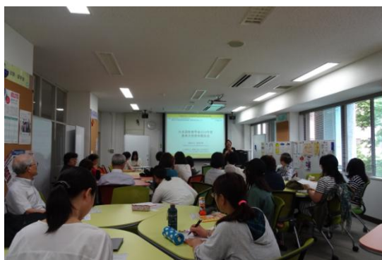
当日は愛媛県内の多様な方が集まりました

なお、この支部活動は、愛媛大学国際連携推進機構国際教育支援センターと共催で行われました。 (報告者 高橋志野)