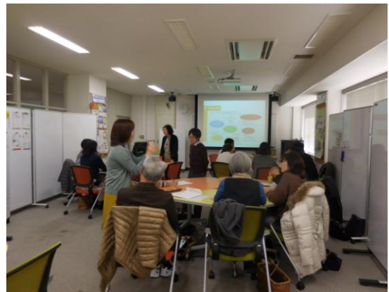
報告後は活発な意見交換が行われました