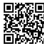
「問診票」へのアクセス QR