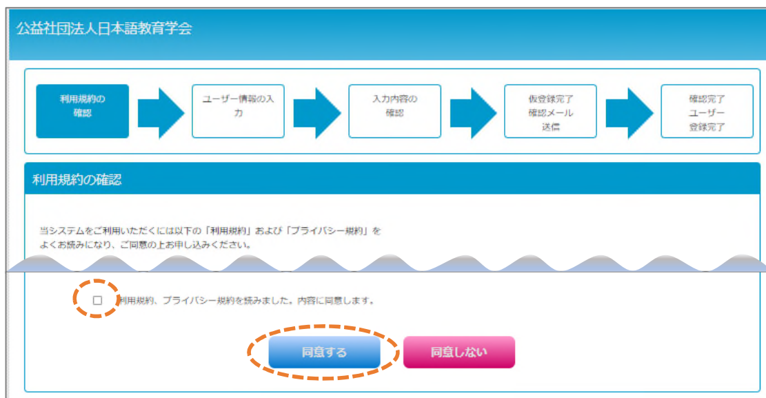
図2 利用規約の確認画面

2. 利用規約の確認画面(図 2)の利用規約とプライバシー規約を読み、同意頂けましたら、ページ下部のチェックボックスにチェックを入れ、「同意する」をクリックしてください。