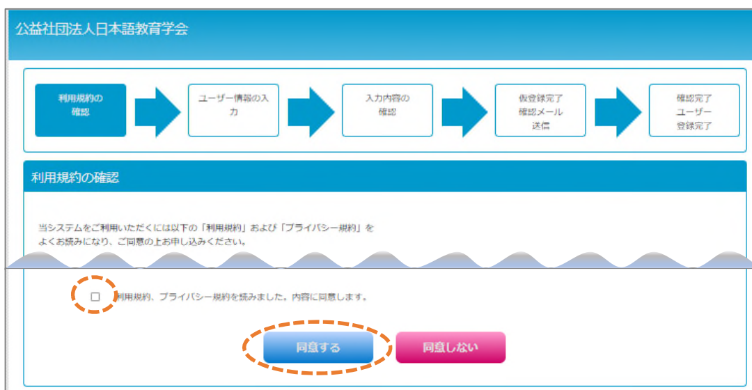
図2 利用規約の確認画面

2. 利用規約の確認画面(図 2)の利用規約とプライバシー規約を読み、同意頂けたら、ページ下部のチェックボックスにチェックを入れ、「同意する」をクリックしてください。