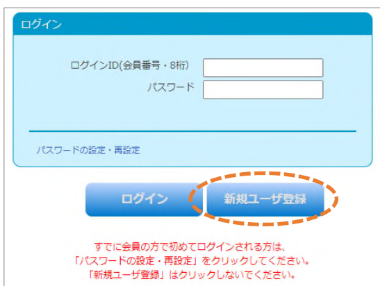
図1 「マイページ」ログイン画面

本イベントへのご参加には事前登録が必要です。日本語教育学会会員以外の方(非会員)も、お気軽にご参加ください。はじめての方は、事前登録に先立ち、ユーザ登録をお願いします。(会員の方は下記5へお進みください。)