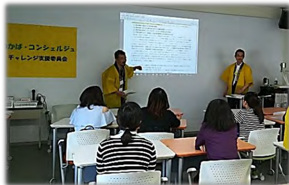
「チャレンジ支援委員会コラボ企画」