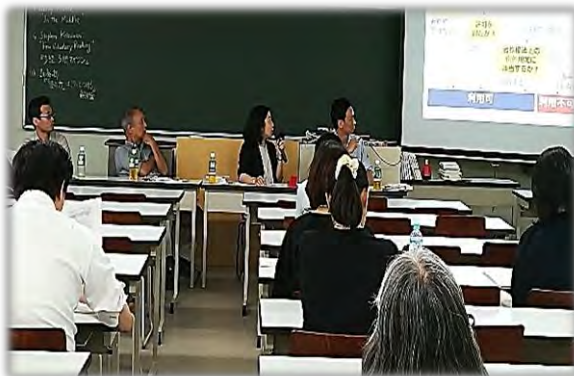
「ラウンドテーブル」

しかしながら、研究発表の少なさや、企画内容の改善を指摘する意見も寄せられました。今後の支部集会への要望として、「研究発表の増加」や「ワークショップ、ラウンドテーブル、よろず相談などの継続」があげられました。来年度の企画に向けての課題としたいと思います。