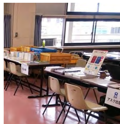
賛助会員出展ブース

アンケート結果によると、支部集会全体についてはおおむね好評ではありましたが、時間が重なるイベントがあったため、一方にしか参加できず残念だったとの指摘がありました。また、賛助会員のブースへの参加者が少なく、事前の広報と当日の案内を工夫する必要性を感じました。これらについては今後の課題としたいと思います。