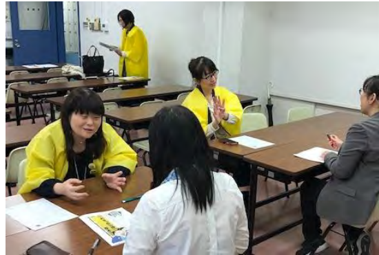
チャレンジ支援委員会「発表応募支援セミナー」