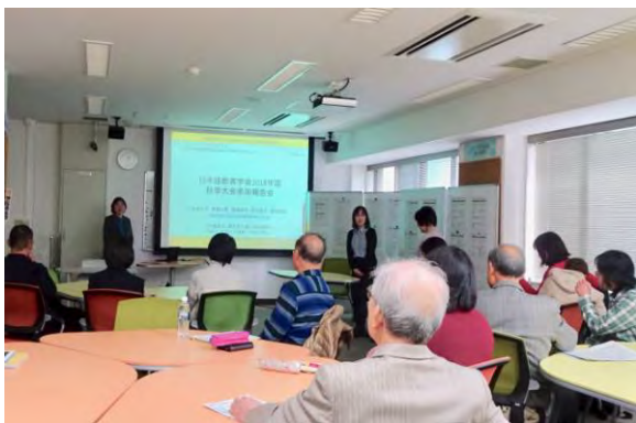
報告会全体のようす

報告会では、まず秋季大会全体の流れを簡単に説明した後、報告者が 1 人ずつ、自分が報告したい大会で得た情報や研究内容について簡単に紹介しました。その後、参加者は、自分の興味がある報告者毎の小グループに分かれてより詳しい話を聞きました。報告会終了後のフィードバックでは、「紹介してもらった教材やアプリに興味を持ちました。これから使ってみたいと思います。」「これから就こうとしている職業についての様々な事が知れて、今後の参考になりました」「(日本語の) 教え方のスキルやソフトの研究もさることながら、外国の人々とどのように共生するかまで検討していることに感心しました。」等、肯定的な意見が見受けられました。