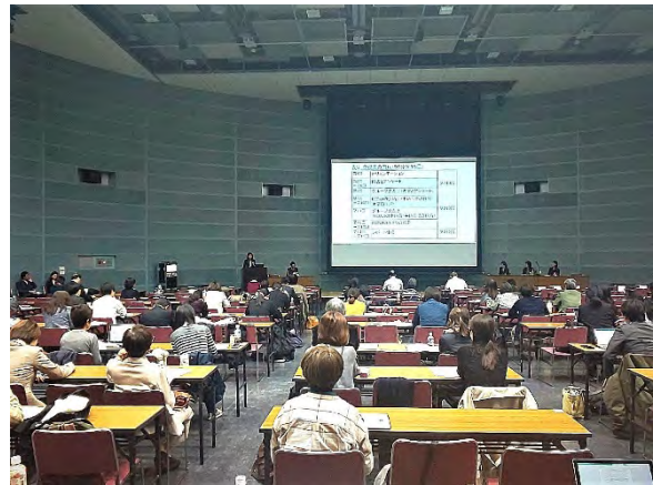
パネルセッション（23日）