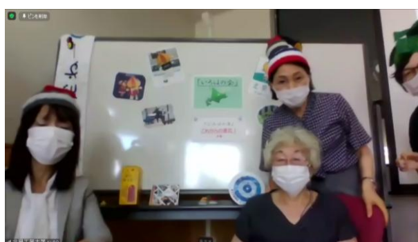
北見会場（北見工業大学）

第2部の交流ひろばには6件の出展があり、北海道の現状から、やさしい日本語による外国人労働者支援、コーパス、授業改善、管理運営業務の見直し、そしてオンライン授業の検証など実に多様なテーマについて意見が交換されました。また、その後の懇親会では、第1部の登壇者の方も含めて、地域、所属の垣根を超えた交流の場を持つことができました。事後のアンケートでは、北海道の地域日本語教育について知る良い機会になったという声が多く寄せられた一方で、意見交換の時間の短さ、オンライン交流の難しさについてのご指摘もありました。来年度どのような形で支部集会を開くことができるのかまだ見通せませんが、今回の経験を活かしより良い形を模索していきたいと思えます。最後に、この場を借りて本支部活動にご参加くださった皆様、そして、本支部活動の開催のためにご協力くださった関係の皆さまに心より感謝申し上げます。