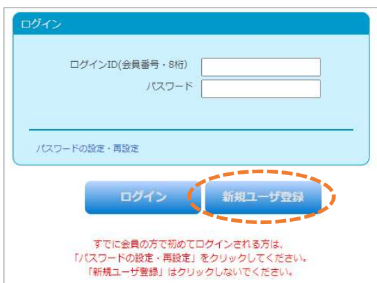
図1 「マイページ」ログイン画面

本イベントへのご参加には事前登録が必要です。日本語教育学会会員以外の方(非会員)も、お気軽にご参加ください。はじめての方は、事前登録に先立ち、ユーザ登録をお願いします。(会員の方は下記5へお進みください。)