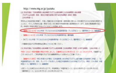
実際の学会のウェブサイトも使って説明しました